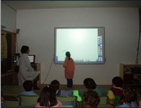
Unha nena facendo unha conta na pantalla táctil (aula de audiovisuais)