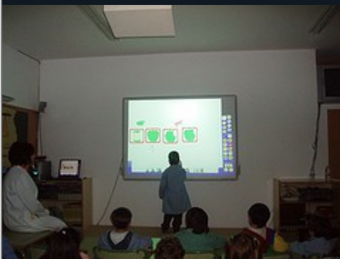
Un neno na pantalla táctil ordenando unha secuencia de imaxes (mazá enteira, mazá con un mordisco, mazás con dous mordiscos e corazón da mazá)

Prácticas escolares por iriapr 02.01.2007 a las 15:10 Temas: Prácticas