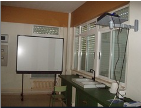
Unha das pantallas co proxector (aula de informática)